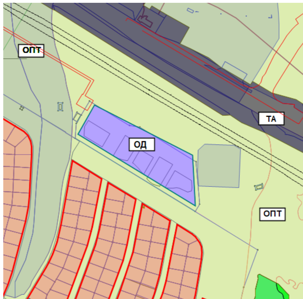
ЧЕРТЕЖ ИЗМЕНЕННОГО ЗОНИРОВАНИЯ